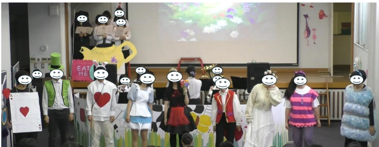
図 9. 追加場面 M3「ようこそふしぎの国へのうた①」

最後に、ナレーションを兼任する王様役の学生が「スマイリーフラワーのおかげでハートの女王が笑顔になったではないか！良かった、良かった！」と子どもたちに語りかける。王様が子どもたちの視線を引き付けている間に、アリスは物語冒頭の眠りについた場所へと移動する。