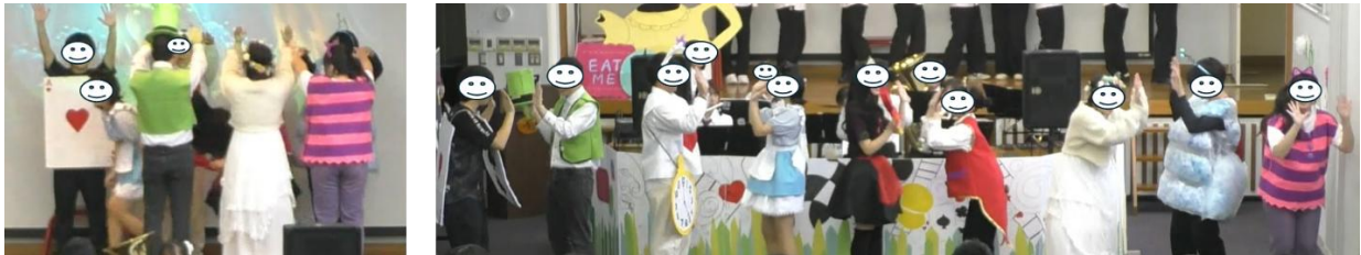
図10. フィナーレ M10「ふしぎワンダーランド②」の場面

令和6年度は、各演者が舞台中央でポーズを決めるなど、カーテンコールとしての演出であった。これに対し、令和7年度は1番の歌詞部分において、学生と指導教員が協働で振付を創作した。振付の構成は、「演者同士の関わり」を重視し、一人では表現できない動きをテーマに据えていた(図10)。