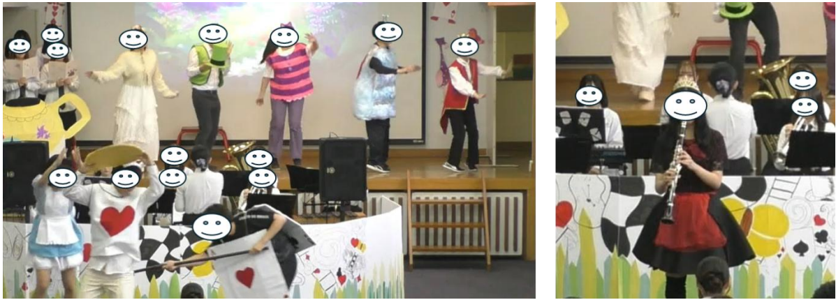
図 8. M9「さいばんのうた②」の場面