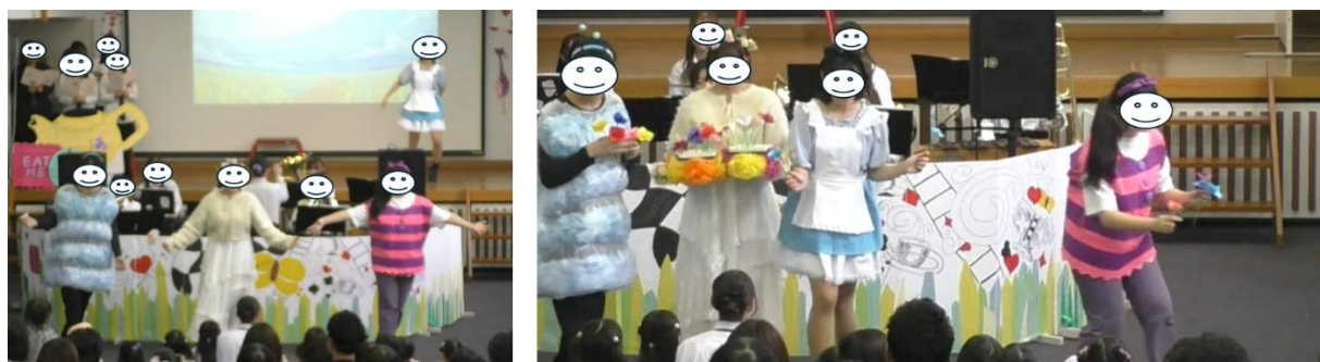
図 3. M3「ようこそふしぎの国へのうた①」の場面

令和 7 年度は、M3 でスマイリーフラワーを演じる学生 1 名が振付を考案し、アリス、チェシャ猫、いもむしを同時に登場させた。M3 終了後にスマイリーフラワーの配布を行った後に M4 を踊る構成へと変更した (図 3)。