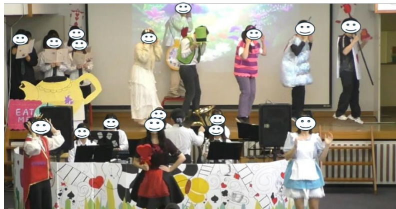
図 7. M8「さいばんのうた①」の場面

令和 6 年度、令和 7 年度とも全演者が登場し、指導教員が考案した振付としたが、令和 7 年度は舞台をより広く使用できる配置であったため、移動を伴う振付へと変更した (図 7)。