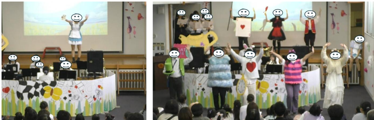
図 2. M1 オープニング「ふしぎワンダーランド①」の場面