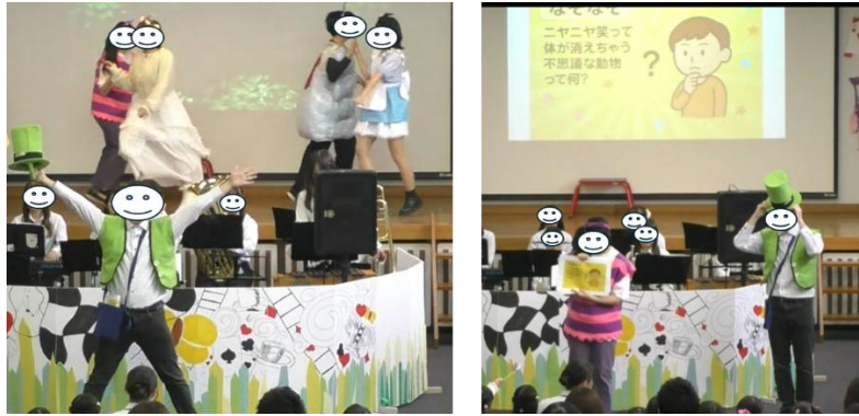
図 4. M5「お茶会チャ・チャ・チャのうた」の場面

さらに、M5 の歌詞に含まれる「なぜなぜ」を観客である子どもたちに問いかける場面を設けた。令和 6 年度は一般的な「なぜなぜ」を出題していたが、M5 の場面を担当する学生の提案により、令和 7 年度では、答えが「スマイリーフラワー」「チェシャ猫」「いもむし」となる内容に変更し、物語の登場人物を子どもたちに印象づける演出とした。(図 4)。