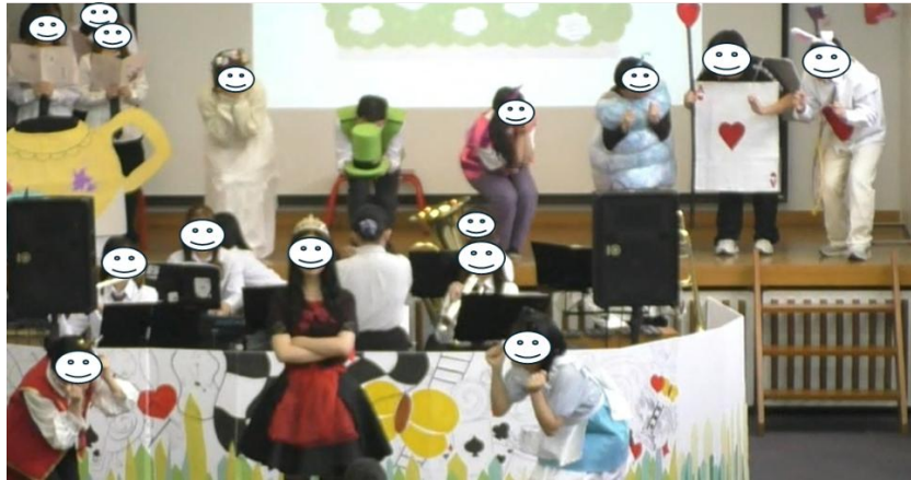
図 6. M7「パイがない!のうた」の場面